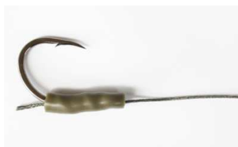
Zur Fixierung bei „no-knot-Knoten“ etc. oder Knotenschutz. Oder als Perleneratz. (Die unteren Bilder entsprechen Vorschlägen für Größe 3.)