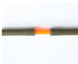
Als Verbinder für Knicklichter oder Rasseln.