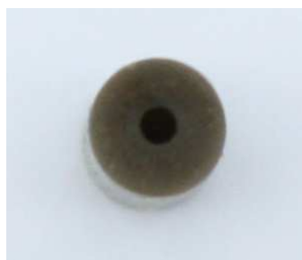
Querschnittansicht des Silikonschlauches Gr. 1

Länge : 1 m Silikon ..... kein Gummi !!! .....kein Verspröden !